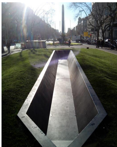
Figuras 9-12. De izquierda a derecha, de arriba a abajo: Inauguración del Monumento a Pi i Margall, 1934. En la cúspide vemos la escultura de Viladomat dedicada a la República. Fuente: Barcelona Atracción , 1936; 1 de abril de 1947, Día de la Victoria. La tipología monumental no ha cambiado pero sí sus elementos escultóricos y simbólicos. La escultura de Viladomat fue retirada en 1939 y sustituida en la base por la escultura de Marès dedicada a la victoria franquista. Fuente: Archivo Fotográfico de Barcelona; Base del monumento vacío tras la retirada de la escultura de La Victoria, el 30 de enero de 2011. Desde 1981 está grabado el escudo de la casa real. Fuente: Núria Ricart; Monumento a Espriu, 2013, y El obelisco al fondo. Fuente: Núria Ricart.