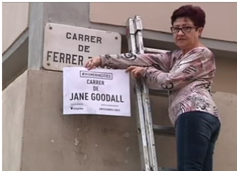
Figura 3: Intervención artística temporal reivindicativa sobre el nomenclátor (Sant Martí de Provençals, Barcelona, 2016).

En las reivindicaciones actuales ligadas a la visibilidad de género y memoria subyace una crítica de los modelos que han constituido las diversas capas de toponimia de la ciudad y que han invisibilizado las figuras referenciales femeninas (figs. 3 y 4). Dichas reivindicaciones han hecho uso de lenguajes «artistas» contemporáneos, y la fuerza de estos movimientos transversales ha tenido consecuencias en las políticas municipales sobre el nomenclátor. En ciudades consolidadas como Barcelona, son los pequeños pasajes y los jardines interiores del ensanche los que llevan, desde hace unos años, nombres de mujeres 9 .