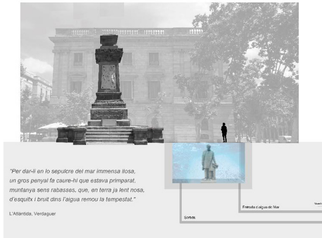
Figura 17: Proyecto L'Atlàntida, 2019. Jordi Guixé (Observatorio Europeo de Memorias) y Núria Ricart (Facultad de Bellas Artes, UB) 35 .

El pedestal, repleto de símbolos elocuentes de la relevancia del personaje, se mantiene como fuente de información del pasado. Entre estos símbolos, hallamos una cita del poema «La Atlántida», de Jacint Verdaguer, se dice que escrito en uno de los barcos del marqués. Se trata de una cita en catalán ubicada en el pedestal en 1952.