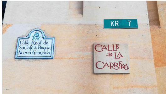
Figura 2: Carrera 7, Bogotá (2019).

Los procesos de significación a través del nomenclátor parecen abordar programas basados en el vacío y la falta como mecanismo para el ejercicio de nuevas visibilidades que, a su vez, determinarán otros vacíos, otras faltas (fig. 2).