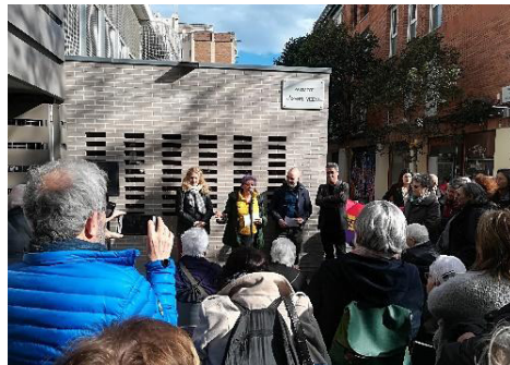
Figura 4: Inauguración del Pasaje de Isabel Vicente, 12/4/2018. Promueve Plataforma Futur Monumento Cárcel de Mujeres de les Corts, EUROM, Distrito de Gracia-Ayuntamiento de Barcelona.