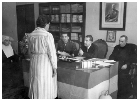
Figura 5: Día de la Mercè, Cárcel de Mujeres de les Corts, 1944, Barcelona, Pérez de Rozas. Fuente: Archivo Fotográfico de Barcelona.

La fotografía de Pérez de Rozas hecha en el Día de la Mercè de 1944 en la Cárcel de Mujeres de les Corts (Barcelona), en plena posguerra, puede ilustrar esta lógica (figs. 5 y 6). La fotografía fue tomada en el despacho del director como ejercicio propagandístico del régimen franquista, que de forma magnánima escenografiaba la puesta en libertad de una presa.