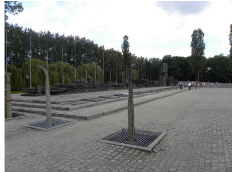
Figuras 15 y 16: Vista del Monumento en Auschwitz-Birkenau, proyecto de síntesis entre diversos equipos, 2015.

Este ejemplo, paradigmático en muchos sentidos, nos sirve para atender a una de las cuestiones expuestas desde el inicio.