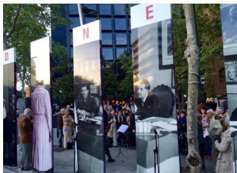
Figura 6: 14 de abril de 2015, Espacio de memoria Cárcel de Mujeres de les Corts, Barcelona (Acto conmemorativo organizado por la Plataforma Futur Monument Presó de Dones de les Corts).

En 2014, esta misma fotografía sirve, en el proceso ciudadano de recuperación de la memoria «Futur Monument Presó de Dones de les Corts» 14 , para marcar el antiguo territorio de la cárcel con unos tótems escultóricos e informativos. La lectura contemporánea de esta imagen nos interpela y aproxima al conocimiento de las estructuras y modos de la dictadura franquista y, en especial, a la posición de la mujer fuera de los estamentos de poder del ejército, la tecnocracia