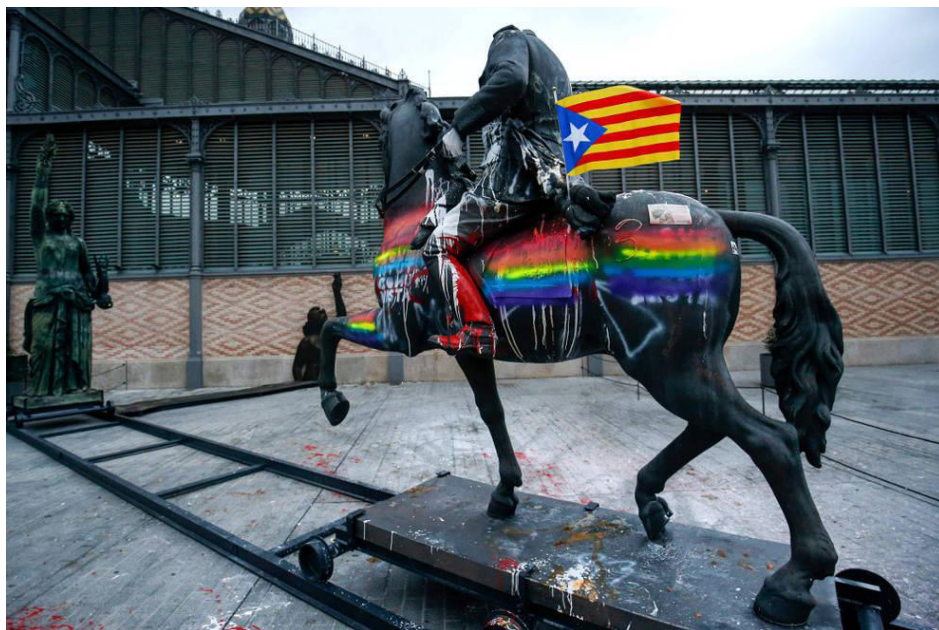
Figura 1: Vandalismo contra la instalación Franco Victòria República , en el Centro de Cultura y Memoria del Born, epicentro simbólico del independentismo catalán. Barcelona, 2016.

Tensiones que en ocasiones afectan de modo preponderante a los elementos simbólicos de dicho espacio, convirtiéndose incluso en objeto de discordia. La respuesta social a elementos patrimoniales o instalaciones de arte contemporáneo —ligados a acontecimientos de escala local o internacional— muestra la preminencia política del espacio y la capacidad simbólica del arte para la transmisión de mensajes y valores. A través de la acción, la apropiación, la provocación, la ironía..., el arte público despliega hoy códigos tipológicos, formales y temporales propios de la contemporaneidad; y con ellos vuelve a ser leído como símbolo de comunicación y transmisión de valores y contravalores de una sociedad convulsa —y por tanto reactiva—, en que la memoria es a la vez objeto de investigación y debate ideológico.