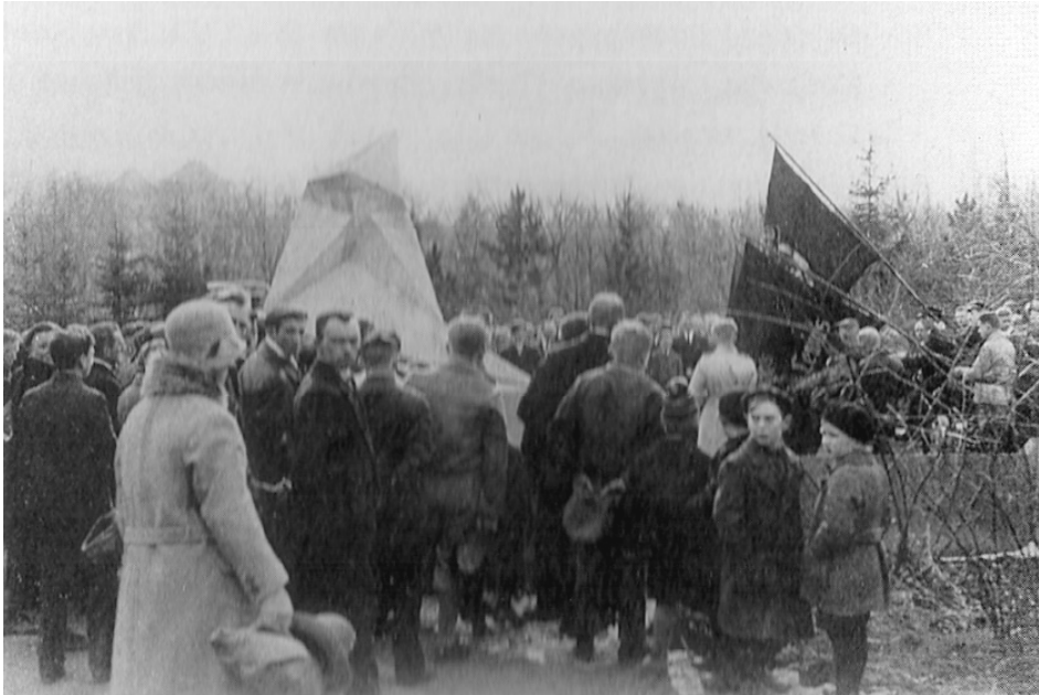
Figura 7: Margenfallenen Denkmal, Walter Gropius. Ofrenda popular, 1925.

Su capacidad comunicativa es, en teoría, enorme; de hecho, en todas nuestras ciudades y pueblos existen espacios y objetos artísticos y/o arquitectónicos especialmente simbólicos para la ciudadanía; lugares con carácter para aglutinar las demandas y reivindicaciones conmemorativas, políticas y/o festivas de momentos históricos diversos que se re-significan generacionalmente (fig. 7).