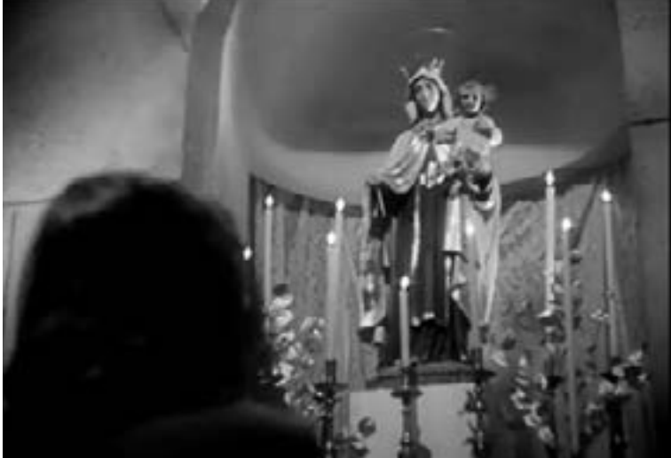
Porque te vi llorar.