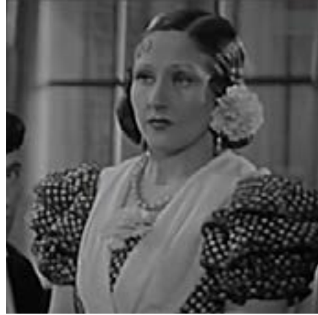
Suspiros de España.

ahora sí, coincidían con su criterio. Primer Plano por su parte seguía con su cruzada particular tratando de regenerar al cine español que surgió en una época de «decadentismo liberal», manifestado por la existencia de un cine folclórico 27 . Sin embargo ya no veremos en la revista ningún enfrentamiento entre las dos instituciones. Si en 1939 la demanda de la Iglesia de que hubiera además de la censura general otra de carácter regional y local era duramente criticada, ahora alabará que las autoridades locales, civiles o eclesiásticas puedan prohibir una película aprobada por la censura oficial. Para el autor esto evitaría «la quiebra de sencillas costumbres populares o la mentalidad blanca de agrupaciones selectas» 28 .