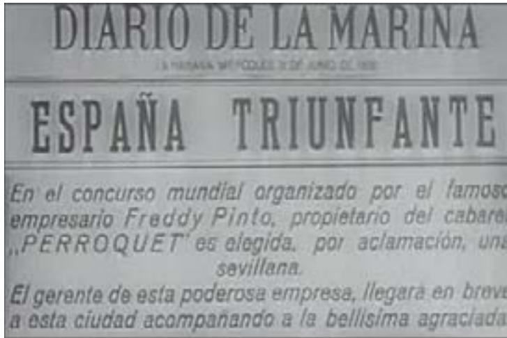
Suspiros de España.

En Mariquilla terremoto , hay un abismo entre la visión de la «honradez» de la mujer y la que nos propondrán poco más tarde, por ejemplo, en La Dolores (Florián Rey, 1940). Mariquilla es engañada por un hombre y sufre unas consecuencias inmediatas, pero su personaje triunfará y conseguirá la felicidad sin que este hecho le marque en absoluto.