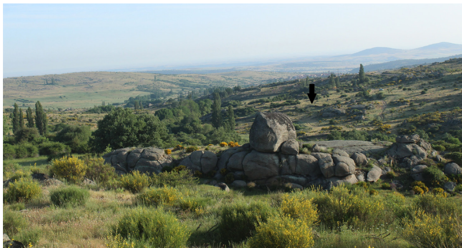
Figura 2. El sitio de La Coba (San Juan del Olmo, Ávila). La flecha señala el poblado central.

Finalmente, el territorio de la comarca de Valdeorras mostraría un proceso intermedio entre la fuerte ruptura durante la octava centuria en las zonas del valle del río Sil y la continuidad y expansión de poblamiento en las zonas de montaña. Así, diversos yacimientos localizados en la zona sedimentaria, tales como O Castelo (Valencia do Sil) o A Proba (O Barco de Valdeorras) muestran fuertes signos de abandono durante la quinta centuria 74 . Todavía no contamos con yacimientos con contextos claros de la sexta y séptima centuria en el territorio, pero evidencias indirectas en sitios como la villa de la Cigarrosa, Santa María de Mones, el cercano sitio de Penadominga o el propio sitio de O Castelo mostrarían un poblamiento poco intensivo y concentrado en unos pocos enclaves a lo largo del valle 75 . Así mismo, la presencia de numerosos elementos constructivos decorados en mármol datados entre la séptima y la décima centuria vinculados a distintos edificios de culto sugerirían no solo la presencia de una relevante élite regional, sino también la incorporación del territorio a escalas suprarregionales de poder a partir de la octava centuria 76 , como también se ha argumentado para otros territorios del noroeste peninsular 77 .