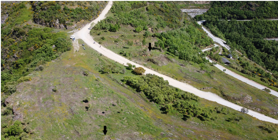
Figura 3. Yacimiento de Penedo Xudío. La flecha superior señala el cementerio, mientras que la parte inferior correspondería al poblado.